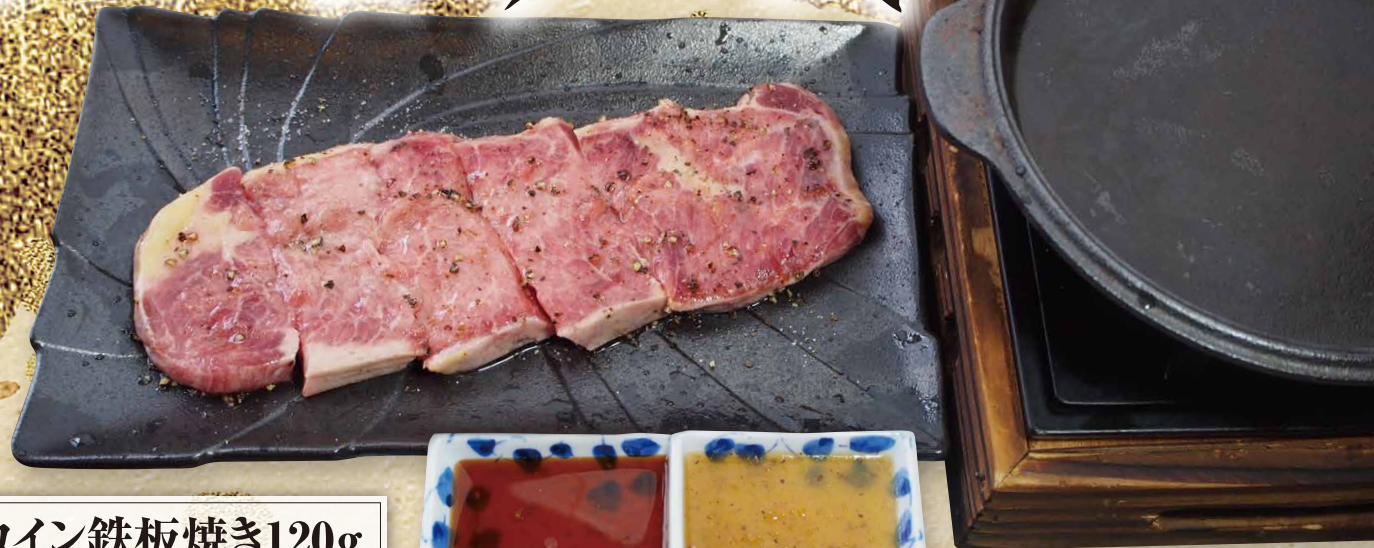
サーロイン鉄板焼き120g 1,390円(税込1,529円)