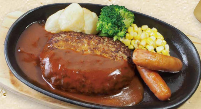
ハンバーグ&ウィンナー 1,030円(税込1,133円)