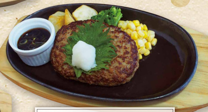
和風おろしハンバーグ 940円(税込1,034円)