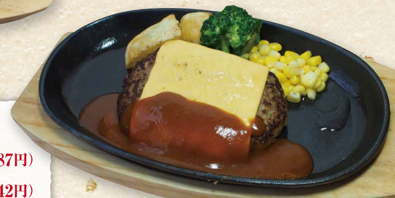
チーズハンバーグ 930円(税込1,023円)