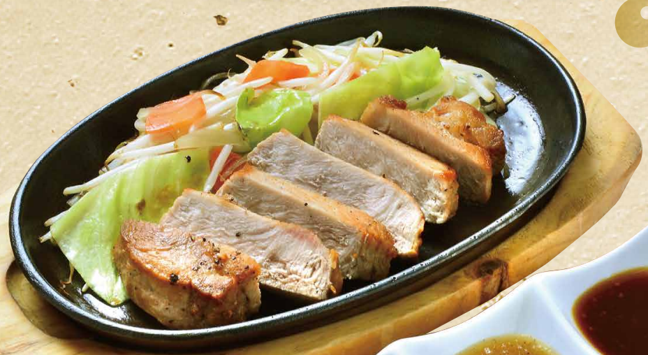
厚切りポークステーキ 1,030円(税込1,133円)