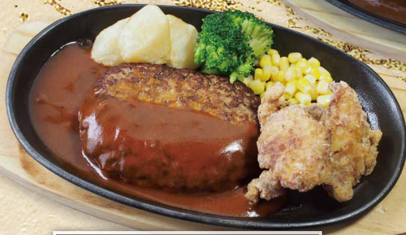
ハンバーグ&唐揚げ(3個) 1,120円(税込1,232円)