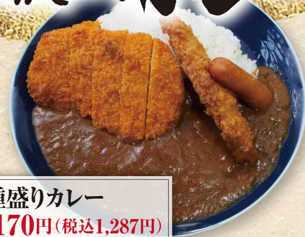
3種盛りカレー 1,170円(税込1,287円)