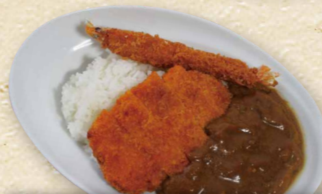
有頭エビフライとカツカレー 1,090円(税込1,199円)