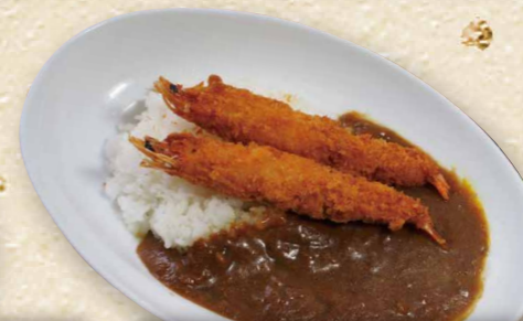
有頭エビフライカレー 1,060円(税込1,166円)