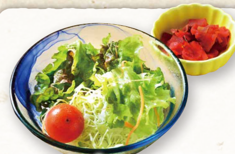
カレーセット..... +290円(税込319円)