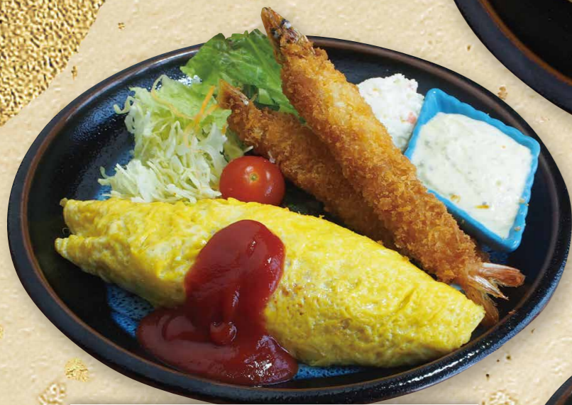
オムライスと有頭エビフライ 1,180円(税込1,298円)