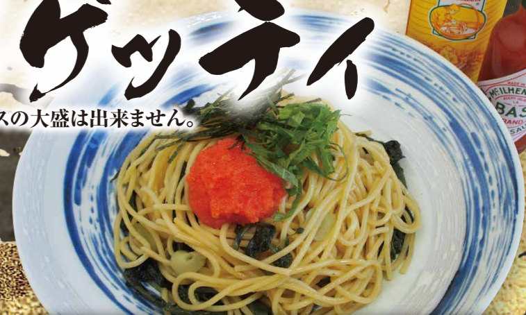
明太子と山菜の和風スパゲッティ 890円(税込979円)