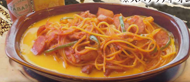
名古屋風ナポリタンスパゲッティ 890円(税込979円)