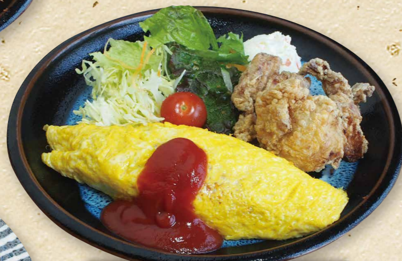
オムライスと鶏の唐揚げ 950円(税込1,045円)