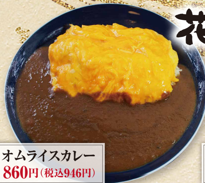
オムライスカレー 860円(税込946円)