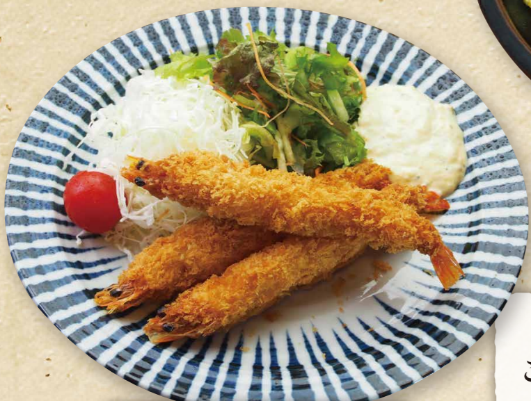
有頭エビフライ 1,280円(税込1,408円)