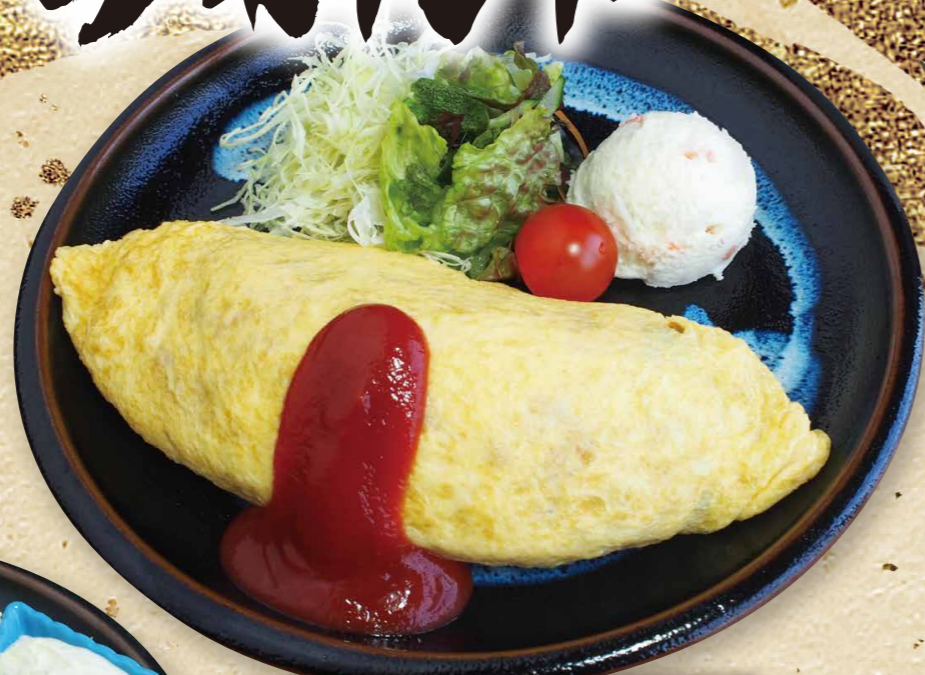
昔なつかしオムライス 830円(税込913円)