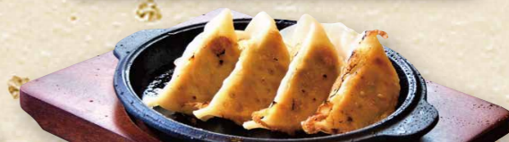
鉄板焼き餃子(6個) 420円(税込462円)