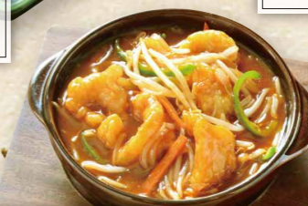
天然海老の甘酢あんかけ 780円(税込858円)