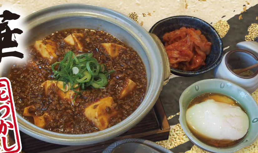
麻婆豆腐 かさね味 810円(税込891円)