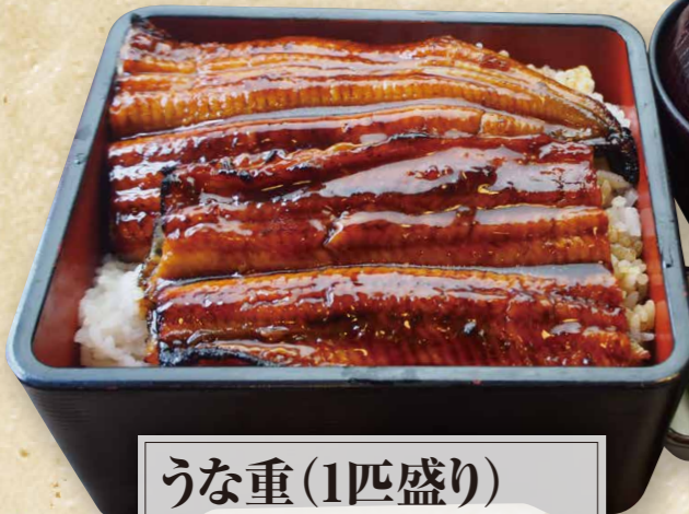
うな重(1匹盛り) 3,420円(税込3,762円)