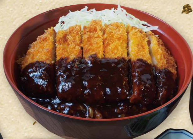
三元豚の味噌カツ丼 910円(税込1,001円)