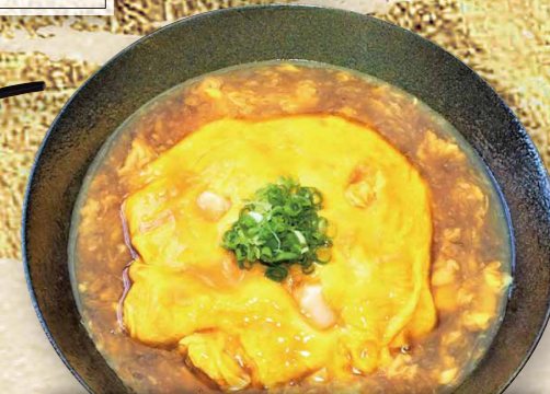
貝柱の入った天津飯 890円(税込979円)