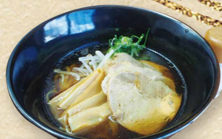
特製醤油ラーメン 790円(税込869円)