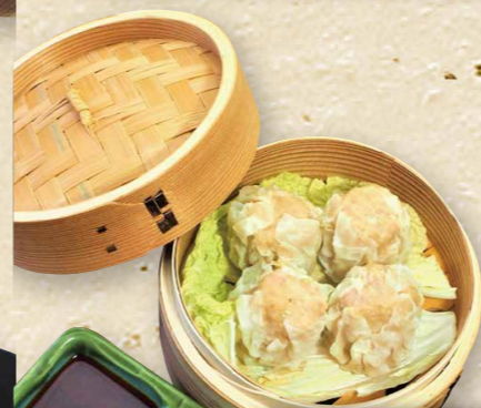
ごろっと黒豚どでかい焼売 790円(税込869円)