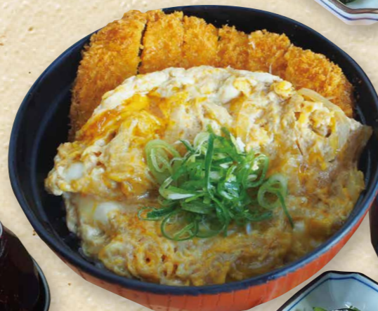
三元豚のローストンカツ丼 930円(税込1,023円)