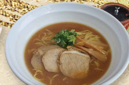
豚骨醤油ラーメン 790円(税込869円)