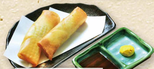
パリッと春巻き 390円(税込429円)