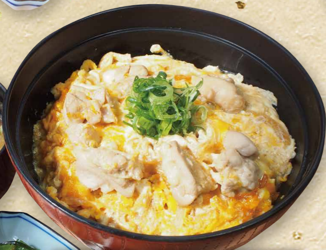
ふんわり玉子の親子丼 880円(税込968円)