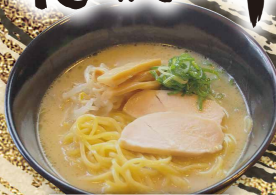
鶏白湯ラーメン 810円(税込891円)