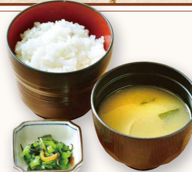
ご飯セット…… 260円(税込286円) ご飯大変更…… +50円(税込55円)